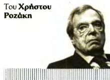
Του Χρήστου Ροζάνη

ντα χρόνια αμφισβητήσεων και έμπρακτες, εμπράγματος καταδείξεις των τουρκικών βλέψεων στο Αιγαίο.