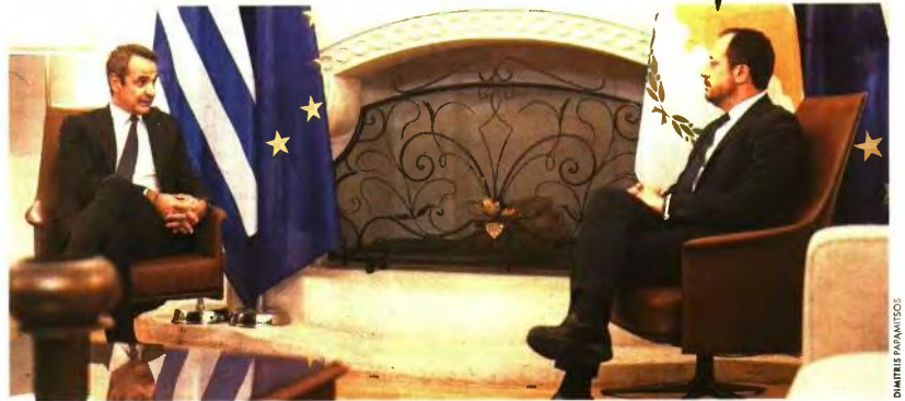
Συνάντηση με τον πρόεδρο της Κυπριακής Δημοκρατίας, Νίκο Χριστοδουλίδη, είχε ο Πρωθυπουργός Κυριάκος Μητσοτάκης στο προεδρικό μέγαρο της Κύπρου